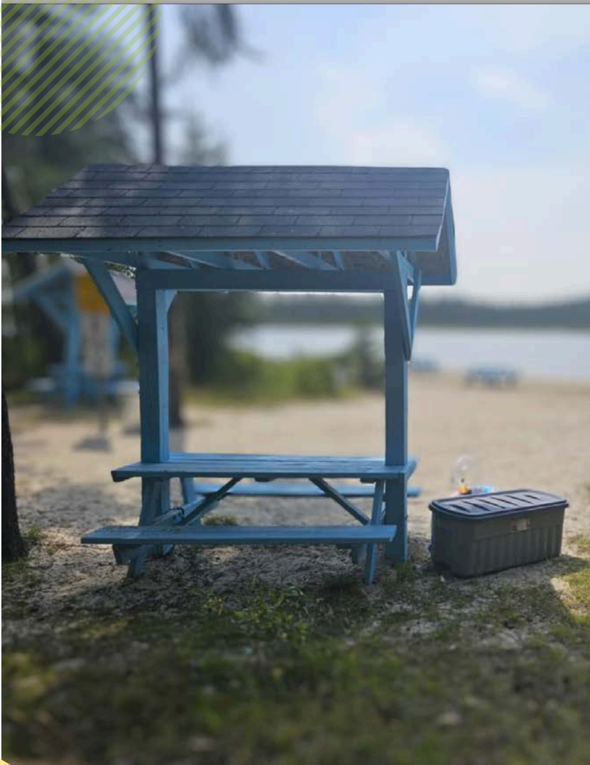
Photo lac Chambeau